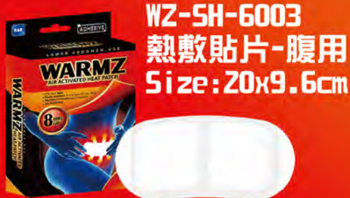
WZ-SH-6003 熱敷貼片-腹用 Size: 20x9.6cm