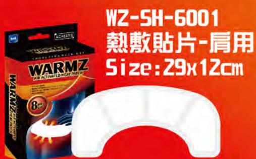
WZ-SH-6001 熱敷貼片-肩用 Size: 29x12cm