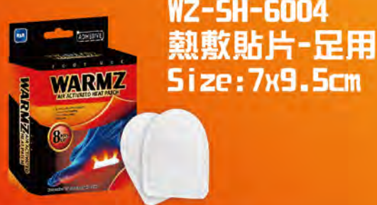
WZ-SH-6004 熱敷貼片-足用 Size: 7x9.5cm