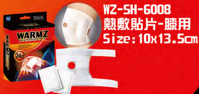
WZ-SH-6008 熱敷貼片-膝用 Size: 10x13.5cm