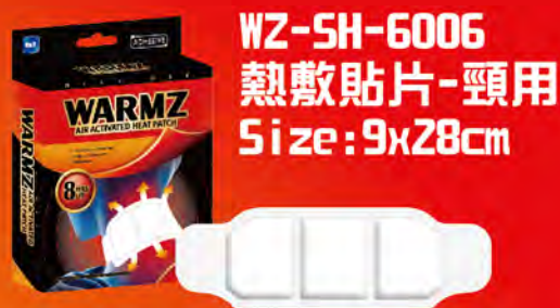
WZ-SH-6006 熱敷貼片-頸用 Size: 9x28cm