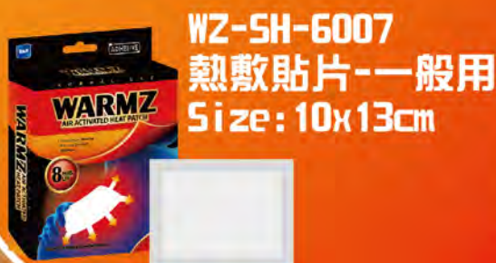
WZ-SH-6007 熱敷貼片-一般用 Size: 10x13cm