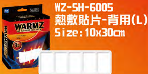
WZ-SH-6005 熱敷貼片-背用(L) Size: 10x30cm