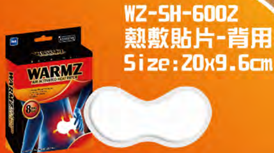
WZ-SH-6002 熱敷貼片-背用 Size: 20x9.6cm